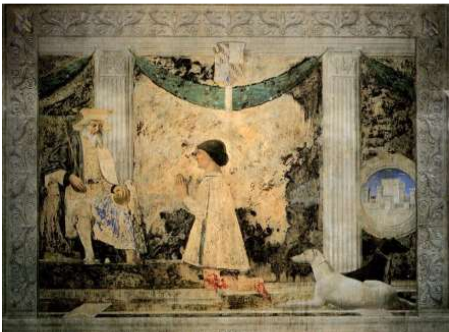
Малаягеста перед св. Сигизмундом, своим покровителем