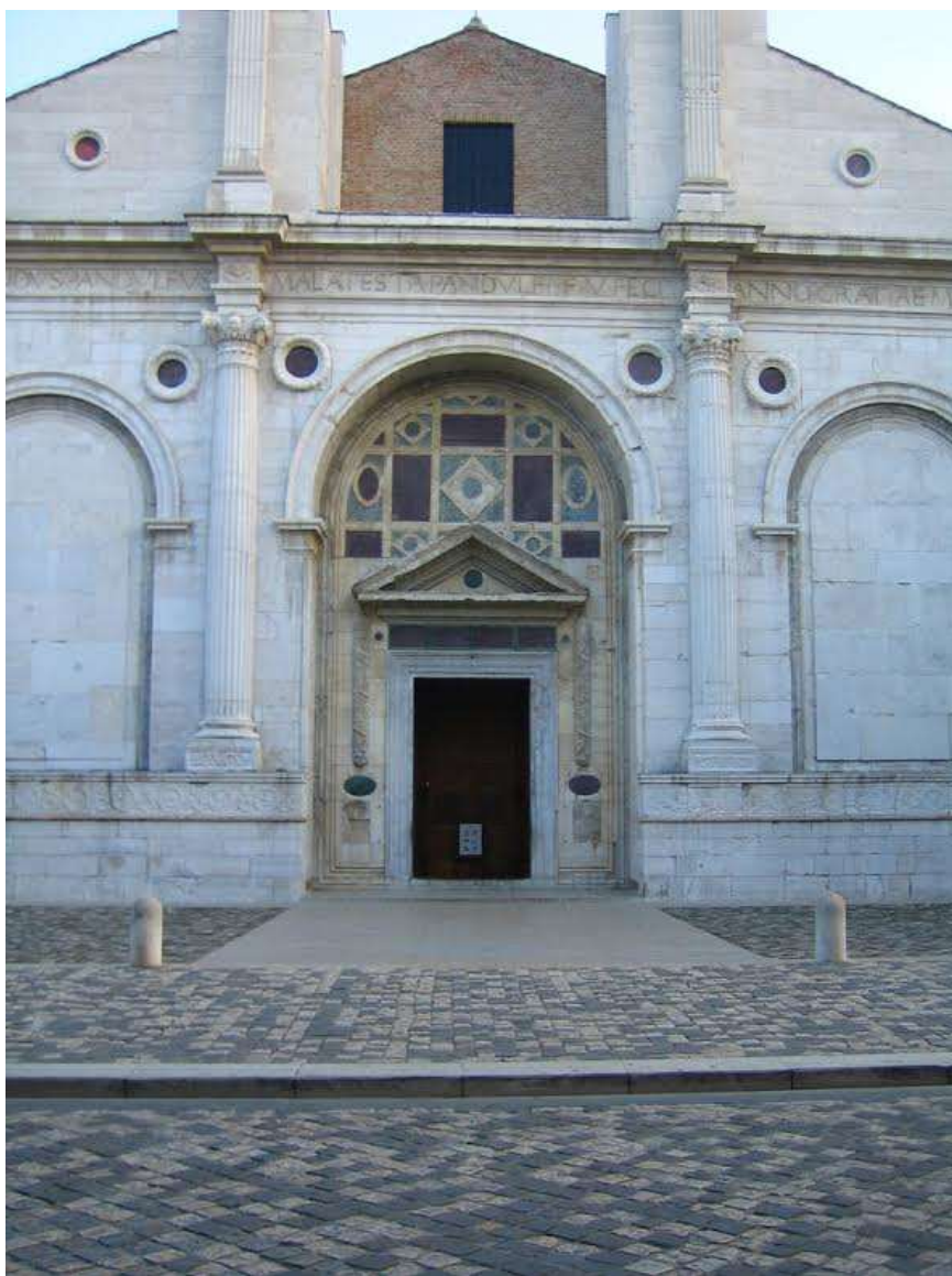
Храм Малатесты. Церковь св. Франциска в Римини