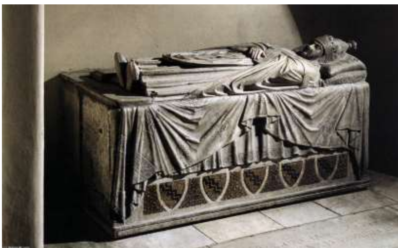
Арнольфо ди Камбио. Гробница папы Бонифация VIII