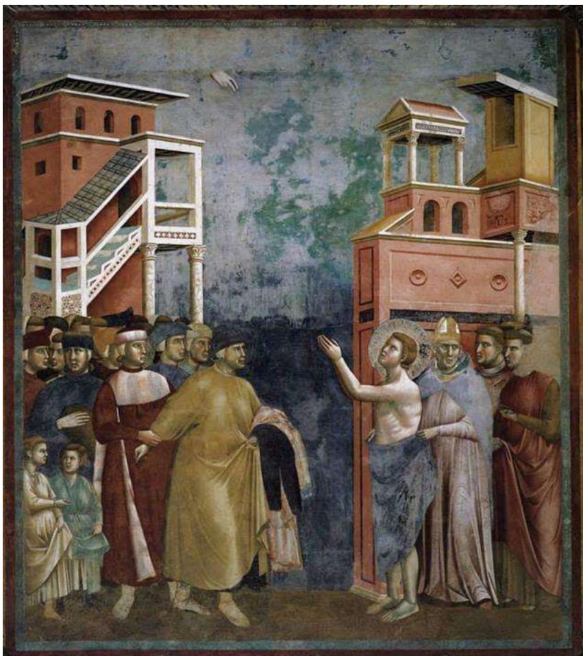
Франциск. Отказ от владения имуществом