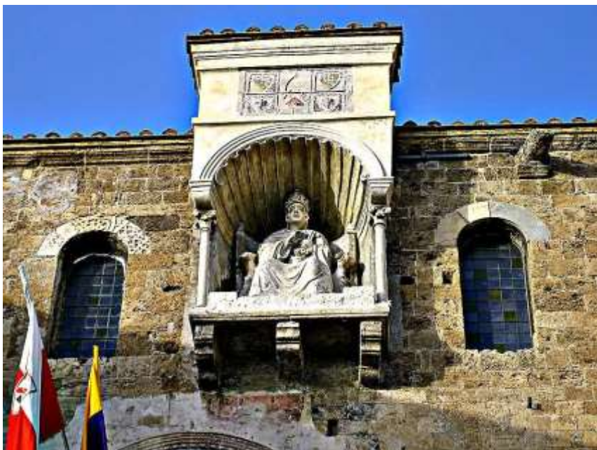
Статуя папы Бонифация VIII в Ананьи