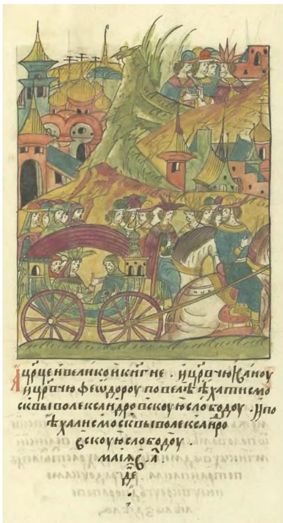
Илл. 8. Лицевой свод. Синодальный том. Л. 585. (МС. (23): 439.) Great Illustrated Chronicle. Synod volume. F. 585.