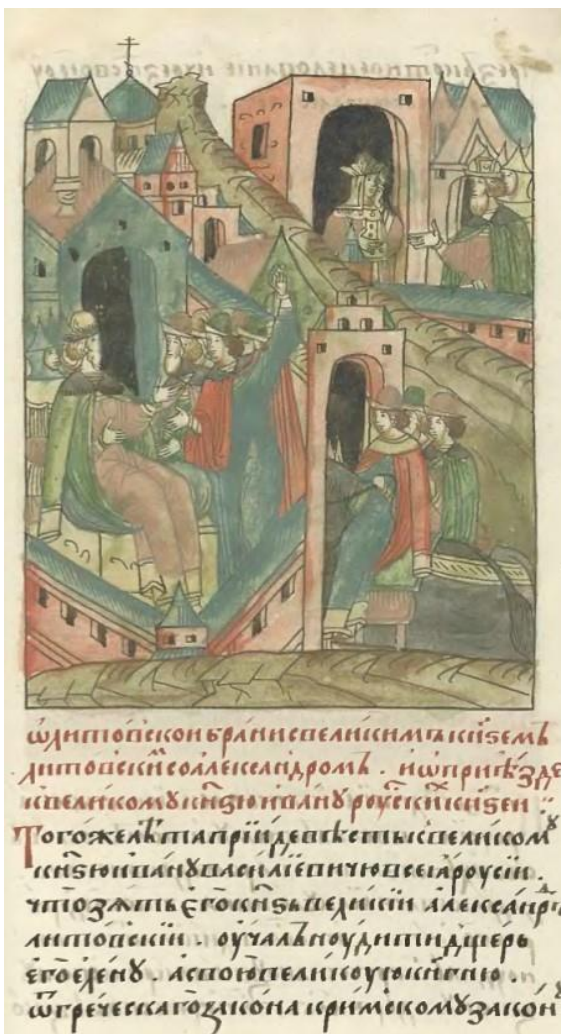
Илл. 2. Лицевой свод. Шумиловский том. Л. 583. (ЛС. (17): 419.) Great Illustrated Chronicle. Shumilov volume. F. 583.