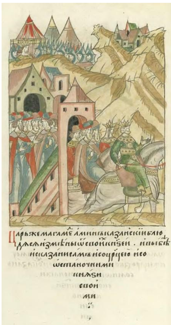
Илл. 4. Лицевой свод. Шумиловский том. Л. 531 об. (ЛС. (17): 316.) Great Illustrated Chronicle. Shumilov volume. F. 531v.