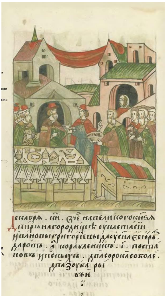
Илл. 1. Лицевой свод. Шумиловский том. Л. 148 об. (ЛС. (16): 76.) Great Illustrated Chronicle. Shumilov volume. F. 148v.