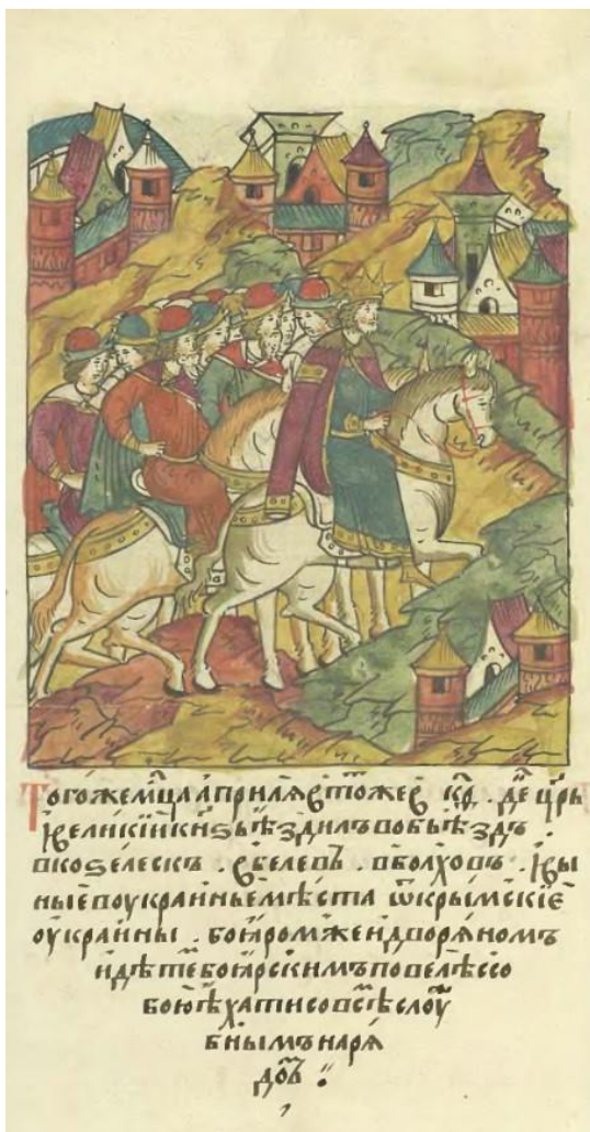
Илл. 7. Лицевой свод. Синодальный том. Л. 584 об. (ЛМС. (23): 438.) Great Illustrated Chronicle. Synod volume. F. 584v.