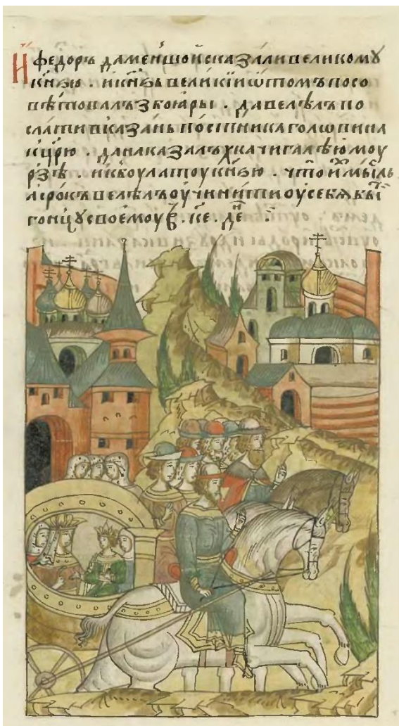
Илл. 3. Лицевой свод. Шумиловский том. Л. 904 об. (ЛС. (19): 62.) Great Illustrated Chronicle. Shumilov volume. F. 904v.